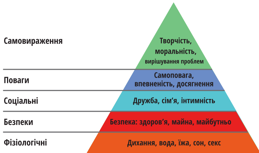
Піраміда потреб Абрагама Маслоу

Класифікують потреби за різними критеріями: за засобами задоволення — на матеріальні і духовні; за способами задоволення — індивідуальні й колективні. Існує також класифікація потреб людини, що отримала назву «Піраміда Маслоу».